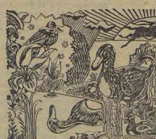
Рис. Л. РЯБИНИНА.